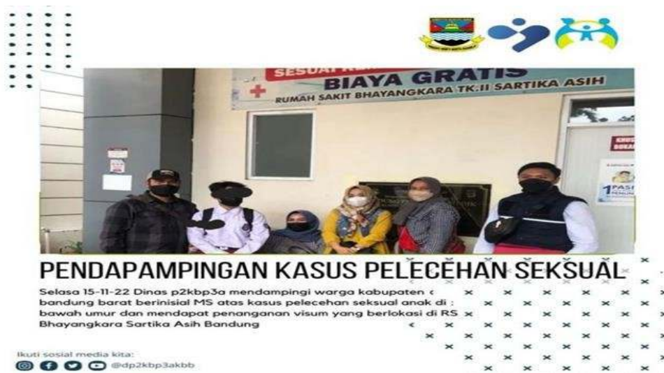
Gambar : contoh peran pendampingan