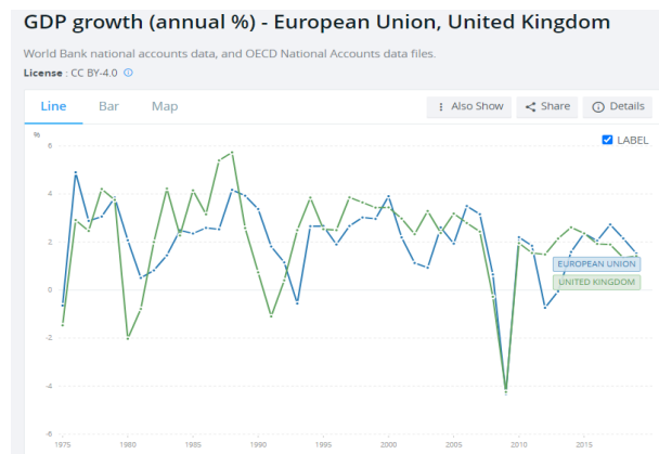
Gambar 1. Perbandingan GDP UK-UE

Pemilihan untuk menarik diri UE didasari oleh permasalahan perekonomian domestik Inggris yang cenderung kurang bervariasi. Sebagai negara dengan kekuatan ekonomi besar Inggris hanya fokus pada negara berkembang, sebagian besar interaksi perdagangan hanya dilakukan dengan negara anggota UE. Pengeluaran Inggris dalam biaya keanggotaan UE juga dinilai tidak sebanding dengan feedback dan keuntungan yang dirasakan Inggris.