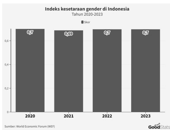
Gambar 1.1 Indeks Kesetaraan Gender di Indonesia Tahun 2020-2023

Sumber: Olahan data Good Stats 2024 merujuk pada Data Badan Pusat Statistik 2024