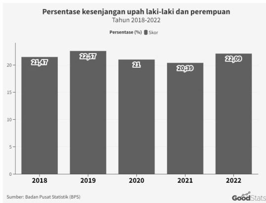
Gambar 2.1 Presentase kesenjangan upah laki-laki dan perempuan Tahun 2018-2022

Sumber: Olahan data Good Stats 2024 merujuk pada Data Badan Pusat Statistik 2024