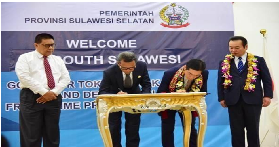
Gambar 2. Penandatanganan Letter Of Intent (Loi)