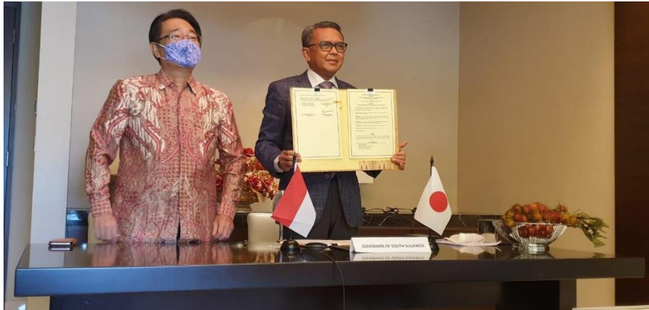
Gambar 3. Penandatanganan MoU Kerjasama Sister Province antara Provinsi Sulawesi Selatan dengan Prefektur Ehime Jepang