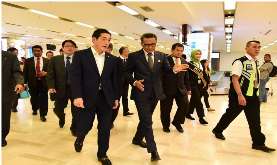
Gambar 1. Kunjungan Gubernur Ehime Di Provinsi Sulawesi Selatan