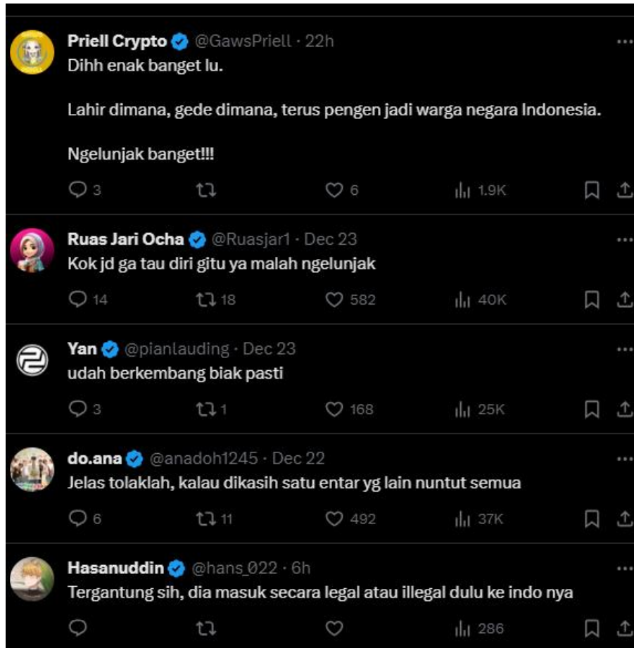
Gambar 2: Respon masyarakat di media sosial 'X' terkait berita pengungsi Rohingya yang minta dibuatkan KTP