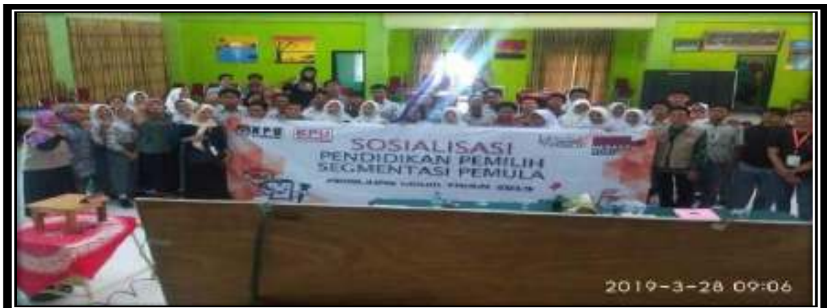
Gambar 4 Sosialisasi Politik KPU Jakarta Timur Basis Pemula