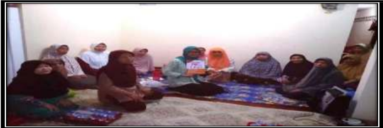
Gambar 3. Sosialisasi Politik KPU Jakarta Timur Basis Perempuan