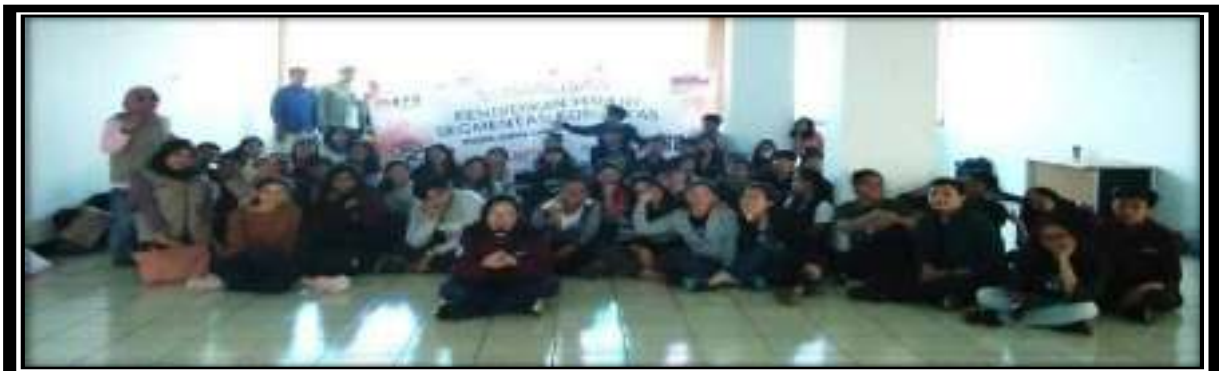
Gambar 5. Sosialisasi Politik KPU Jakarta Timur Basis Komunitas