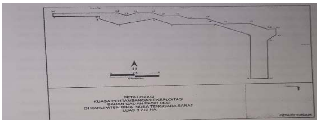
Gambar 1. Lokasi Kuasa Pertambangan Pasir Besi di Kecamatan Wera oleh

Penambangan Pasir Besi di Kecamatan Wera yang dikelola oleh PT. Jagad Mahesa Karya (PT. JMK) dengan koordinat berdasarkan Keputusan Bupati Bima No. 406 tahun 2004 tanggal 7 Maret 2004, tentang Kuasa Pertambangan Eksploitasi Bahan Galian Pasir Besi di Kecamatan Wera dan Ambalawai. Peta lokasi yang menjadi obyek penambangan Pasir Besi di Kecamatan Wera ditunjukkan pada gambar berikut: