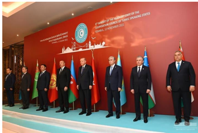
Gambar 4. 3 Eighth Summit Organization of Turkic States

Solidaritas ini tidak bersifat simbolik semata, melainkan menjadi instrumen kebijakan luar negeri Turki di wilayah-wilayah yang memiliki populasi Turkik. Lebih dari sekadar kerja sama bilateral, aliansi militer Turki dan Azerbaijan mengandung dimensi ideologis yang mendalam. 9 Salah satu perwujudan nyata dari ambisi ideologis ini adalah pembentukan dan penguatan Organization of Turkic States.