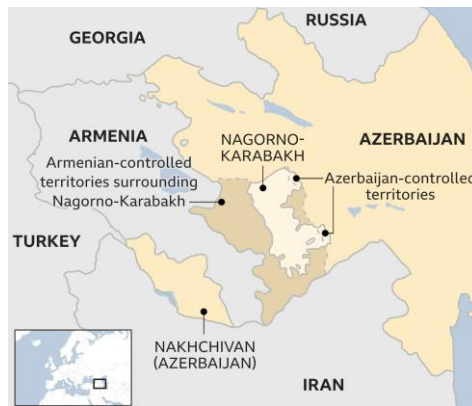
Gambar 1.1 Konflik yang terjadi di wilayah Nagorno-Karabakh