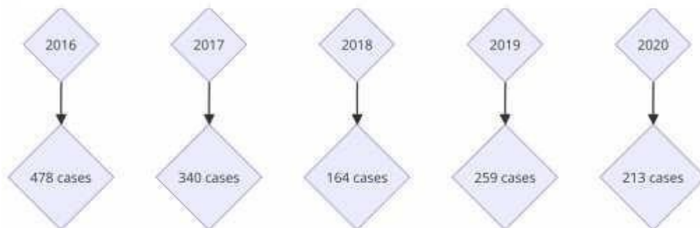
Gambar 2 Diagram Kasus Human Trafficking Indonesia-Malaysia